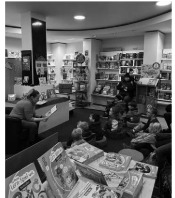
Text und Bild: Stadtmarketing

Der Weingartener Adventskalender hat nicht nur die Gemeinschaft gestärkt, sondern auch die Vorfreude auf Weihnachten spürbar gemacht. Ein herzliches Dankeschön an alle Beteiligten, die diese magische Zeit ermöglicht haben! Diese Veranstaltung hat eindrucksvoll gezeigt, warum Weingarten „mehr“ ist – mehr Gemeinschaft, mehr Nächstenliebe, mehr Zusammenhalt!