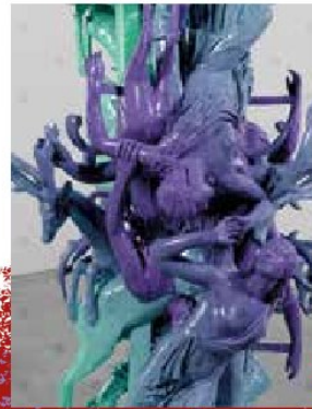
1 Nothing New 2026 , 130 x 170 cm, Öl auf Aluminium, Lack auf Inkjet auf Leinwand, bedrucktes Aluminium

Stadtmuseum im Schloßle Scherzachstraße 1