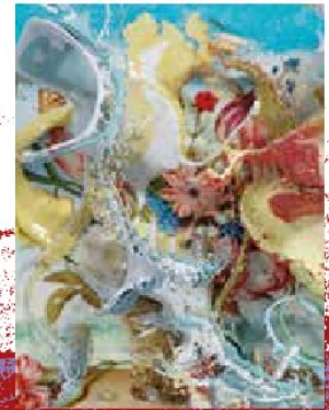
2 Vanitas Still Life 2026 , 130 x 170 cm, Acryl, Öl, Lack auf Inkjet auf Leinwand, bedrucktes Aluminium