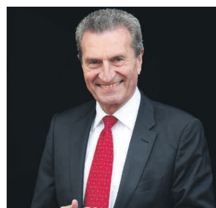
Der weltliche Ehrengast: Günther H. Oettinger, ehemaliges Mitglied und Vizepräsident der Europäischen Kommission; Ministerpräsident des Landes Baden-Württemberg a. D.