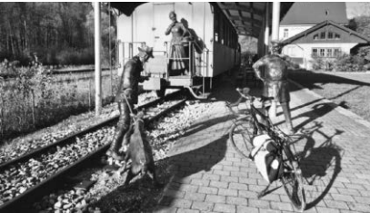
Vom neu angelegten Schussenpark in Ravensburg führt die Tour weitgehend

Am Sonntag, 10. Mai, bietet der ADFC Ravensburg eine Radtour von Ravensburg nach Bad Schussenried entlang der Schussen an (50 Kilometer). Treffpunkt ist der Bahnhofplatz Ravensburg um 10 Uhr oder der BOB-Bahnhof Weingarten / Berg (Westseite) um 10.30 Uhr.