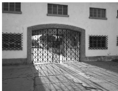
Das ehemalige Lagertor

Umständen den Tod. Weitere Informationen zum zeitlichen Ablauf und dem Programm finden Sie auf der Homepage der vhs oder im Programmheft. Die Studienfahrt kostet 58,90 Euro.