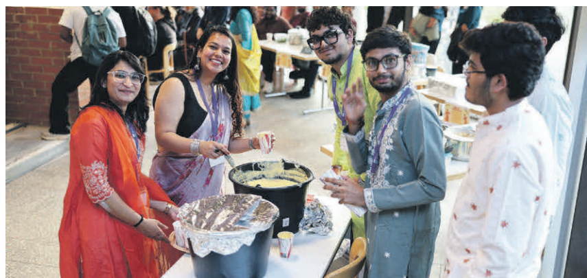
Studierende verteilen Mango Lassi bei der Indian Cultures Night.

Die Themenwoche wurde durch den Deutschen Akademischen Austauschdienst (DAAD) gefördert. Mit rund 10 Prozent indischer Studierender hat der Austausch für die RWU eine besondere Bedeutung. Die positive Resonanz unterstreicht das Potenzial weiterer gemeinsamer Projekte und internationaler Begegnungen.