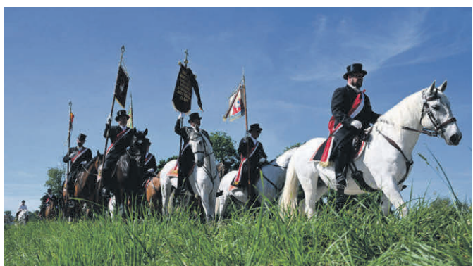
Beim Ritt über Feldwege und Fluren ist Zeit für Gebete und Gedanken.