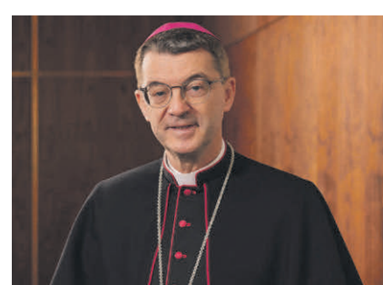
Der kirchliche Ehrengast: Dr. Klaus Krämer, Bischof der Diözese Rottenburg-Stuttgart, hält die diesjährige Festpredigt.