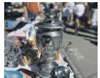
Fundgrube für Schatzsucher mit Spürnase.

Die Anmeldung sowie weitere Infos finden Sie auf der Website www.stadt-weingarten.de/feste . Bei Fragen gerne anrufen unter Telefon 0751 / 405-108 oder mailen an stadtfest@stadt-weingarten.de .