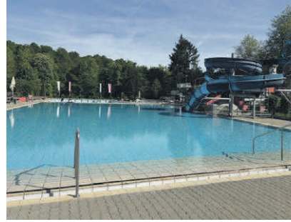
Nichtschwimmerbecken und Riesenrutsche sind bereit für den Sommer.

Text: Tanja Schürbrock