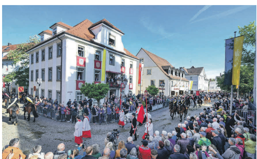
Blick auf das Rathaus: Auf dessen Balkon verfolgen die Ehrengäste die Prozession.