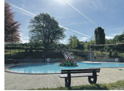
Auch der Eltern-Kind-Bereich ist startklar.