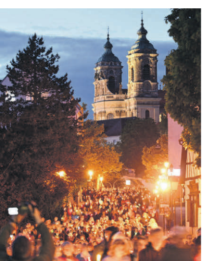
Singend und betend ziehen Gläubige an Christi Himmelfahrt von der Basilika zum Kreuzberg.

Texte: Carolin Schattmann / Markus Wagershauser Bilder: Felix Kästle / Jens Kramer (Diözese Rottenburg-Stuttgart)