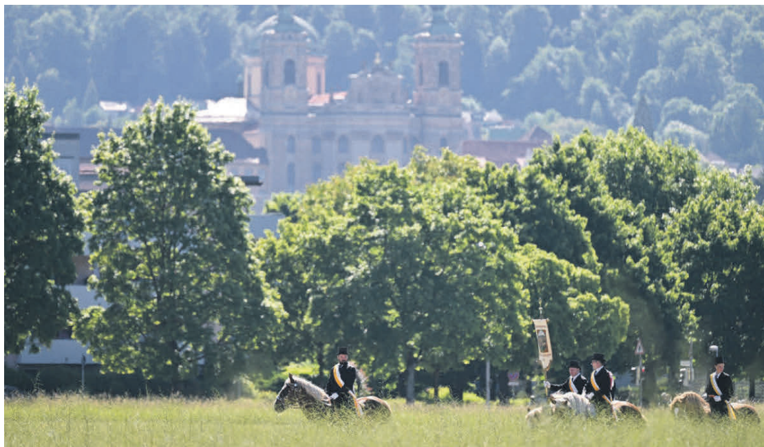
Der etwa zehn Kilometer lange Prozessionsweg führt hinaus aus der Innenstadt – hier mit fantastischem Blick auf die Basilika.

Achtung, sportbegeisterte Schülerinnen und Schüler: Am Sonntag, 12. Juli, findet im Rahmen des Welfenfestes der bereits neunte Welfenlauf statt. Jetzt anmelden!