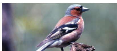
Der Buchfink (hier ein Männchen) kommt noch häufig bei uns vor.