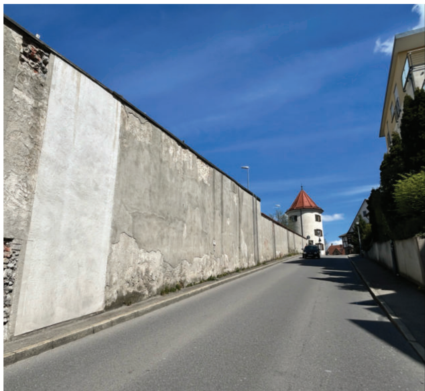
Die Klostermauer, die sich am Gerbersteig über mehr als 100 Meter erstreckt und bis zu fünf Meter hoch ist, muss umfassend instandgesetzt werden.