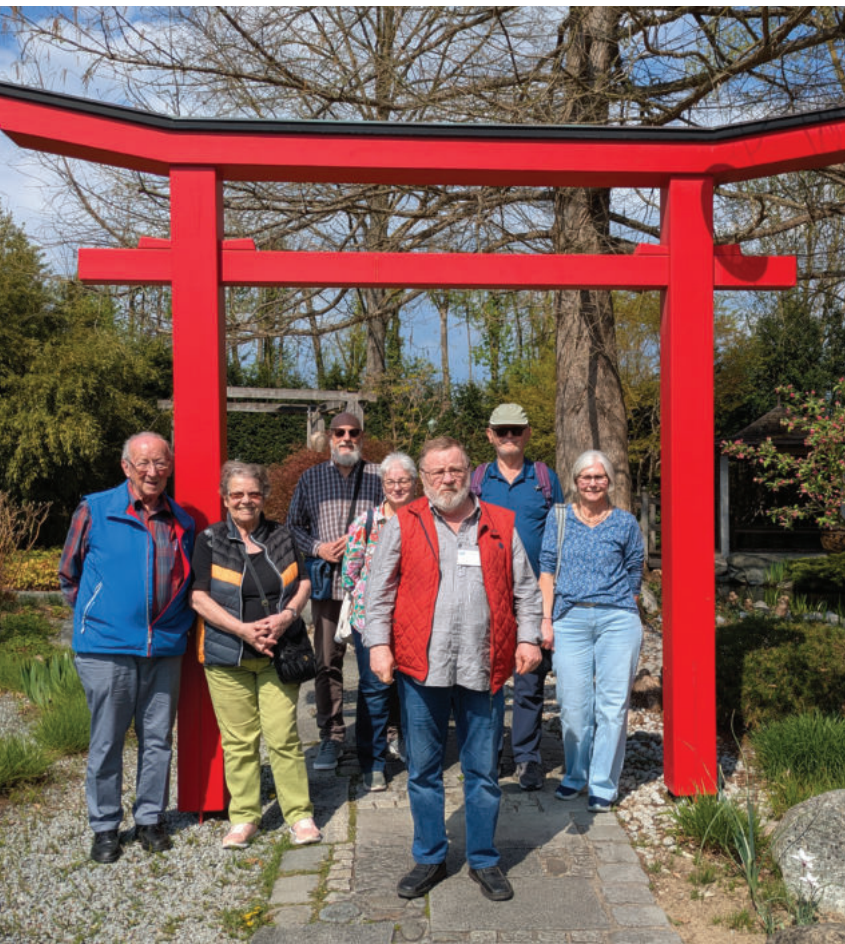
Gut gelaunt im Dehnerpark.