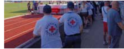
Text und Bild: DRK Weingarten

richten der monatlichen Blutspende. Das DRK Weingarten ist immer präsent.