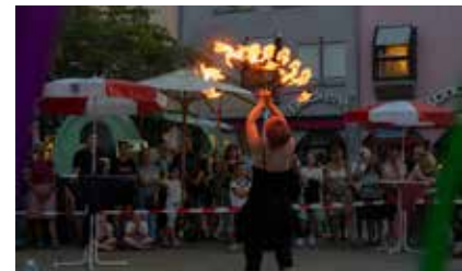
Text und Bild: Stadtmarketing

wieder durch ihr Kommen bereichern. Nach dem Supersamstag ist vor dem Supersamstag: Im September wartet die nächste Veranstaltung des Stadtmarketings. Beim Supersamstag Herbst am 26. September dürfen sich die Besucher auf die große Kinderolympiade freuen, die in diesem Jahr ihr 25-jähriges Jubiläum feiert und noch durch ein „Herbstmärkte“ ergänzt wird.