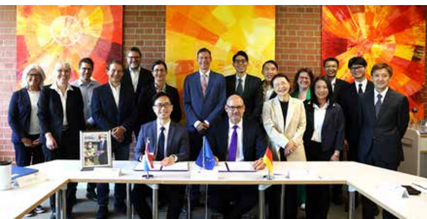
Mit Kooperationsverträgen festigt die RWU ihre internationalen Partnerschaften.