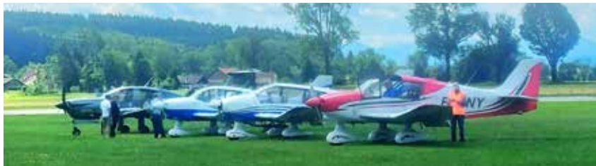
Die Gäste aus Frankreich reisten mit Kleinflugzeugen an.

Nach der Ankunft stand zunächst ein gemeinsames Mittagessen in der beliebten Fliegerkneipe auf dem Programm. Dort wurden die französischen Gäste von drei Vorstandsmitgliedern der Partnerschaftsgruppe willkommen geheißen und konnten sich in geselliger Runde auf das weitere Tagesprogramm einstimmen. Anschließend führte der Weg nach Weingarten. Ein Höhepunkt des Besuchs war die Besichtigung der Basilika, die in französischer Sprache angeboten wurde. Diese Aufgabe übernahm erneut unser langjähriges