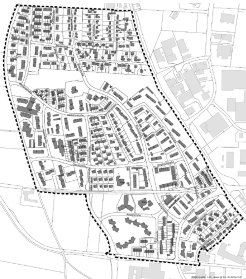
Das geplante Sanierungsgebiet.