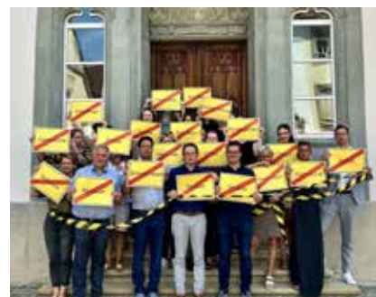
Protest vor dem Amtshaus: Die Stadtverwaltung macht auf die dramatische Lage aufmerksam.

es auch im Internet eine Kampagne, die zeigen soll: Bund und Länder müssen handeln, damit der Staat vor Ort handlungsfähig bleibt. Weitere Hintergründe unter www.kommunenamlimit.de .