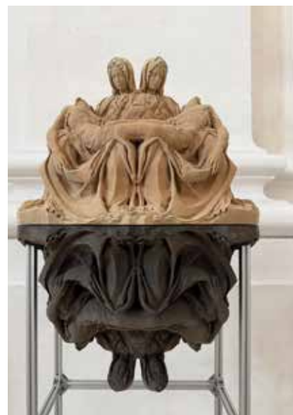
Christian Holzes „Eightfold Pietà“.

Bei der Ausstellung RECTO VERSO mit Christian Holze im PAVILLON am schlossle handelt es sich um eine ortsspezifische Installation, bei der die Basilika eine wichtige Rolle spielt – nicht nur atmosphärisch, sondern ganz konkret: Die Art der Installation sowie die Präsentation der Arbeiten im Pavillon hängen mit der Baustellensituation in der Basilika zusammen. Es befinden sich Arbeiten in der Ausstellung, die einen direkten Bezug zur Basilika haben, und: Während der Ausstellung wird eine Skulptur von Christian Holze, die „Eightfold Pietà – Buried and Unearthed (2025)“, in der Basilika gezeigt. Dem wird beim Kunstspaziergang mit Sabine Sprinz auf den Grund gegangen. Treffpunkt ist um 14 Uhr auf dem Basilikavorplatz, die Kosten betragen 8 Euro pro Person inklusive Eintritt in den Pavillon.