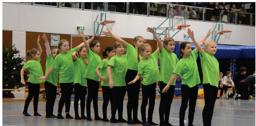
Die Mini Dancers mit ihrer ausgefeilten Choreographie.

Nach dem Weihnachtsmann-Tanz mit Turnstationen der vier Eltern-Kind-Turngruppen zeigten die Tanzmäuse ihre Choreographie und anschließend die Mädchenturngruppe mit Turnerinnen von klein bis groß ihr Können auf Airtrack, Übungsbalken und Minitrampolin.