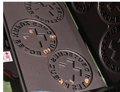
DRK-Waffeln am Stiel verstüßten bei der Feste.