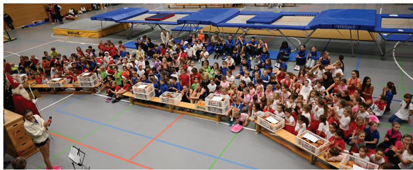
Die zahlreichen Akteure des Nikolausturnens wurden nach ihren Aufführungen vom heiligen Nikolaus und Knecht Ruprecht beschenkt.