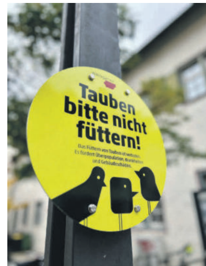
Einer der Hinweise hängt beim Kornhaus.

Mehr zum Thema Tauben lesen Sie im Artikel der neu gegründeten Stadtaubenhilfe Weingarten auf Seite 12.