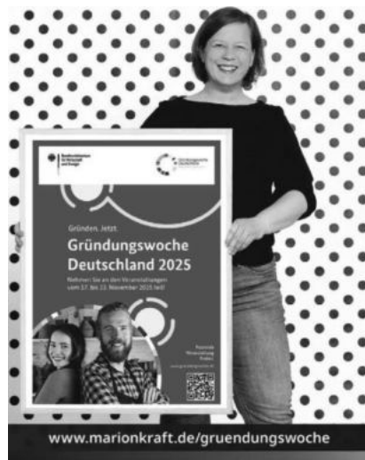
Text und Bild: Marion Kraft

Die Veranstaltung findet von 14 bis 15.30 Uhr im barrierefreien Begegnungsraum FINKA, Prestelstraße 7, in Weingarten statt. Interessierte Gründerinnen und Gründer können sich bis Mittwoch, 19. November, per E-Mail an info@marionkraft.de anmelden. Weitere Informationen zur Gründungswoche Deutschland gibt es unter www.gruendungswoche.de .