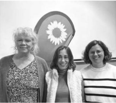
Bei der Mitgliederversammlung des Ortsverbands B' 90/Die Grünen Wein-