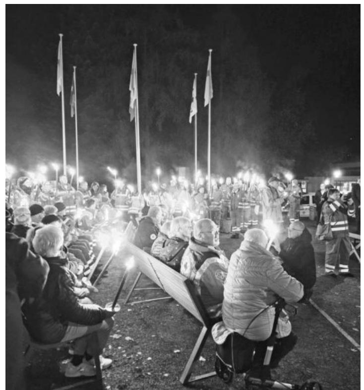
Rotkreuzler bei der Gedenkfeier in Heiden, Schweiz.