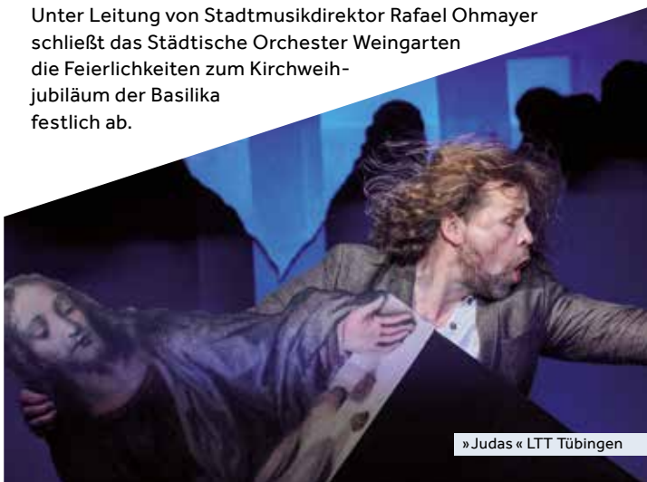
» Judas « LTT Tübingen